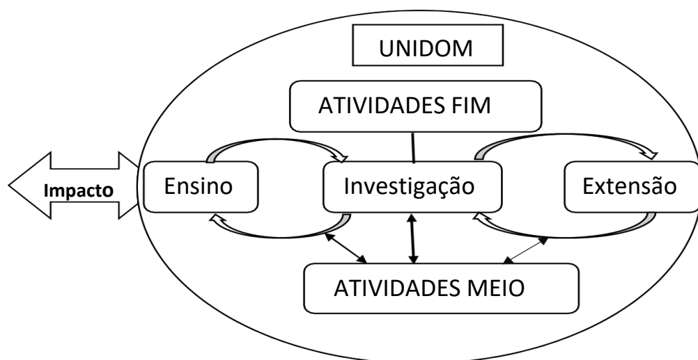
Figura1: Atividades desenvolvidas pela IES e suas repercussão na sociedade